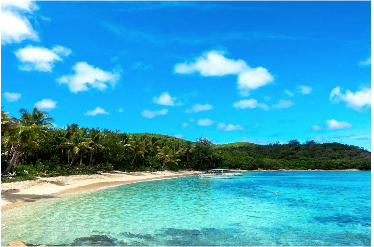
Drawaqa Naviti Island

Das kleine aber feine Resort bietet authentisches, fijianisches Flair und die traumhaften Postkarten-Strände der Yasawa Islands.