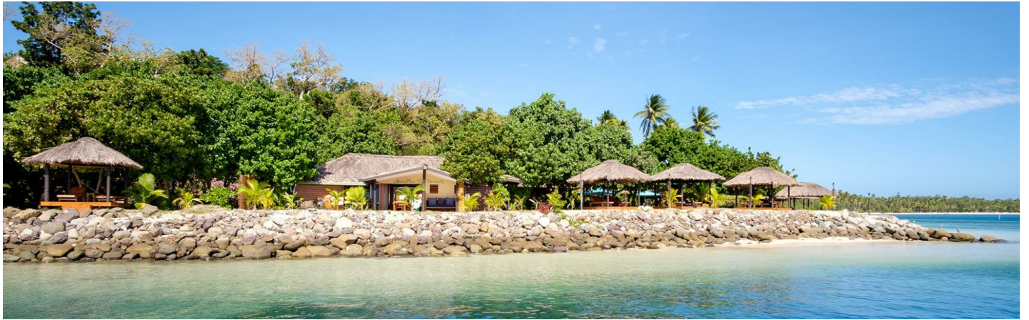
Nanuya Lailai Island

Das auf den wunderschönen Yasawas gelegene Resort besticht mit fijianischer Gastlichkeit und entspannter Ruhe.